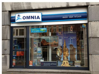
Omnia Travel – Reiskantoor HASSELT

Tel Vakantiereizen: 09 230 40 40 Fax: 09 231 75 88 vakantiereizen.gent@omniatravel.be Openingsuren: ma – vr: 09u00 – 17u30 za: 9u45 – 12u30 (niet in jul. & aug.)