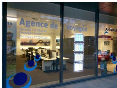
Omnia Travel – Reiskantoor BRUSSEL

Tel Vakantiereizen: 03 202 93 87 Fax: 03 202 91 54 antwerpen@omniatravel.be Openingsuren: ma – vr: 09u00 – 17u30 za: 09u45 – 12u30 (niet in jul. & aug.)