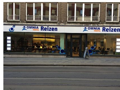
Omnia Travel – Reiskantoor GENT

Tel Vakantiereizen: 02 645 56 12 Fax: 02 645 56 01 brussels@omniatravel.be Openingsuren: ma – vr: 09u00 – 17u00