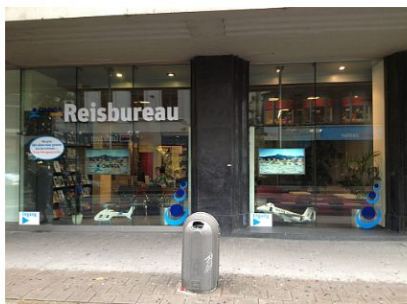
Omnia Travel – Reiskantoor ANTWERPEN